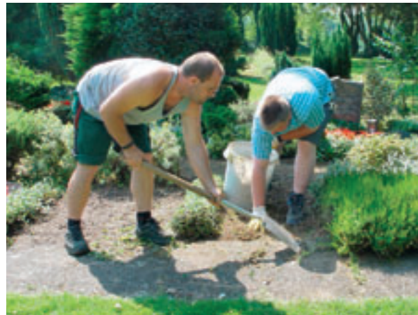
Zeit 00:10 Grab vorbereiten