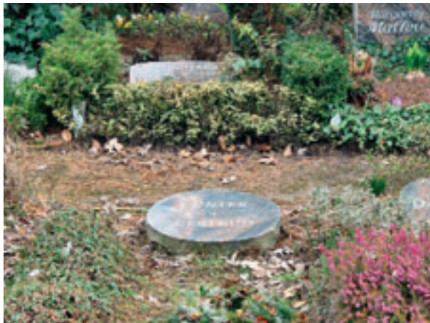
Zeit 00:00 Das Ausgangsgrab