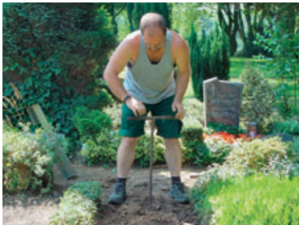
Zeit 00:20 Erdaushub mit Erdbohrer