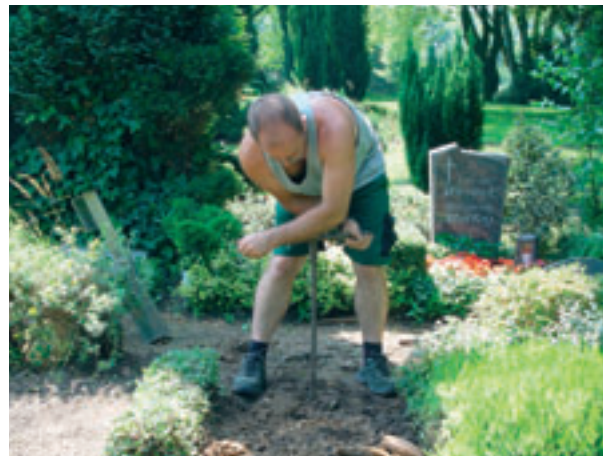
... Erdaushub mit Erdbohrer