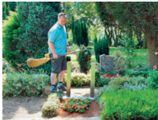
... Vorbereitung für den Einschub der Tafel