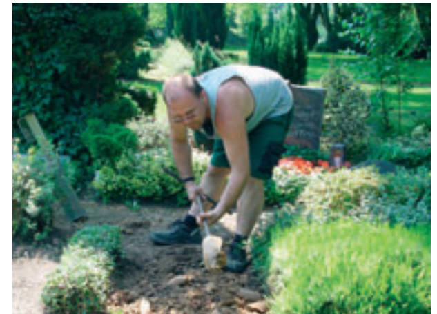
... Grab vorbereiten