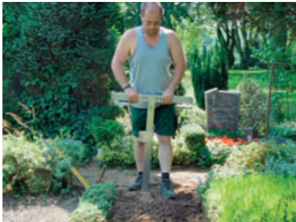
Zeit 00:35 Verankerungssystem setzen