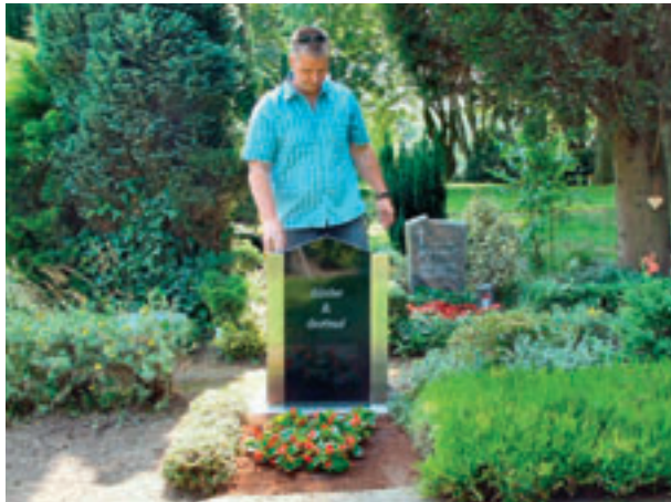
Zeit 00:57 Verankern der Tafel