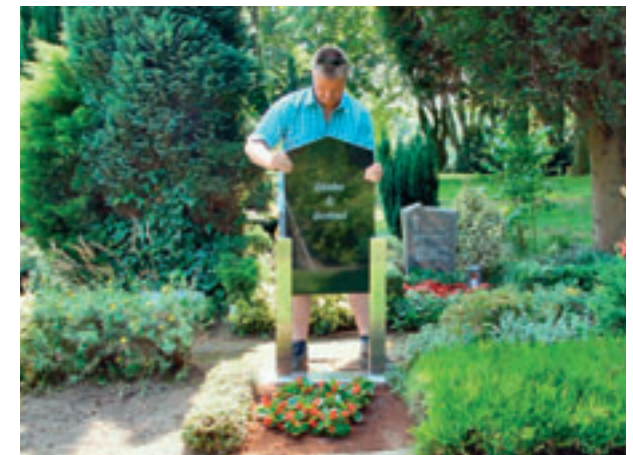
Zeit 00:57 Einschub der Inschrifttafel