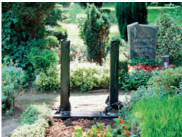
Zeit 00:55 Aufsetzen des Sockels mit den Säulen; Abziehen der Schutzfolie