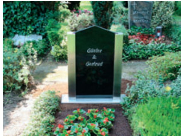
Zeit: 1 Stunde Das fertige Grab